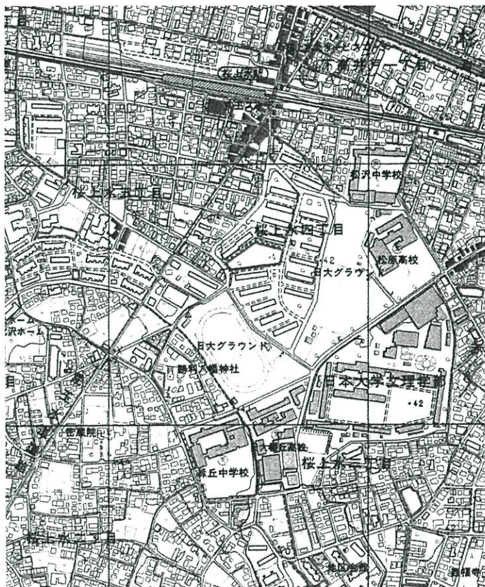
10,000分1「世田谷」平成11年修正