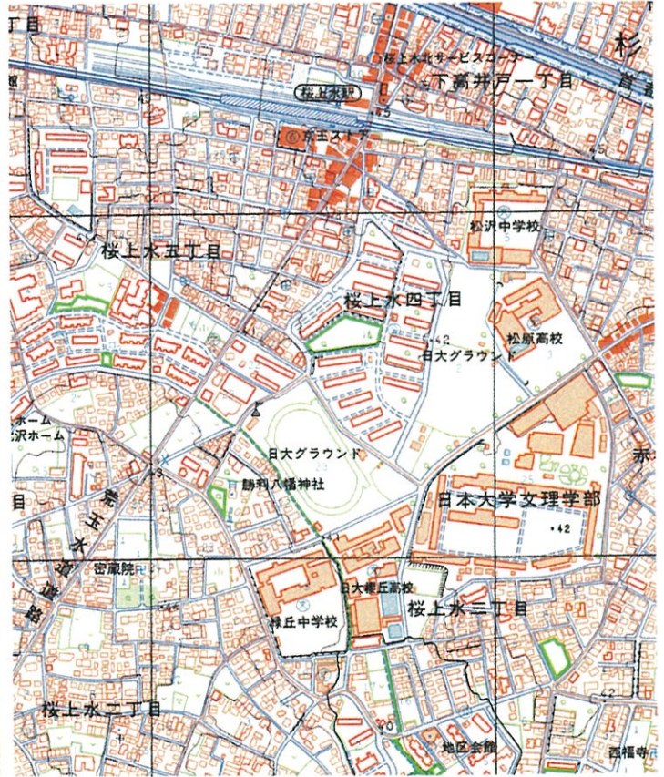
10,000分1「世田谷」平成11年修正